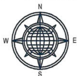
Схема планировочной организации земельного участка.